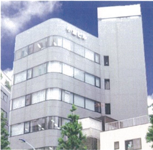
株式会社 LMJ ジャパン