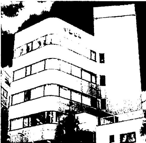
株式会社 LMJ ジャパン

【東会場（東京）】LMJ 東京研修センター（文京区本郷 1-11-14 小倉ビル）