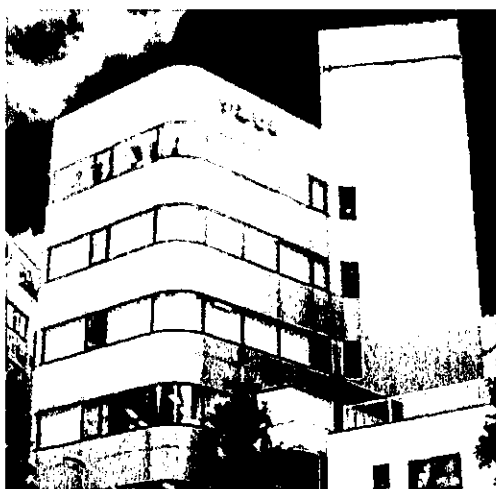
株式会社 LMJ ジャパン

【東会場（東京）】LMJ 東京研修センター（文京区本郷 1-11-14 小倉ビル）