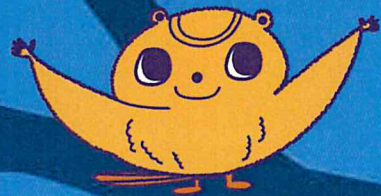
リレー・フォー・ライフ・ジャパン宮崎 応援マスコット「みーもちゃん」

毎年開催しているイベントですが、2020年は新型コロナウイルスにより開催を断念いたしました。2021年は、規模を縮小して開催いたします。ひとりひとりができることを考え、行動していく新しいスタートを共にしましょう。初めての方のご参加もお待ちしております。一緒に希望の光を灯し、つなげましょう。