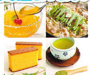
※ 画像はイメージです。

※ 当選者の発表は、賞品の発送をもって変えさせていただきます。 ※ 歩いた歩数を「SALKO」に反映させるためできるだけアプリを1日1回起動してください。 (最低2～3日に1回は起動させる必要があります。)